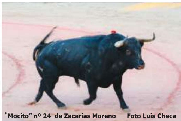
"Mocito" n° 24 de Zacarías Moreno

Por su gran faena, sin trofeos por la espada, al 6º novillo del sábado 27 de agosto