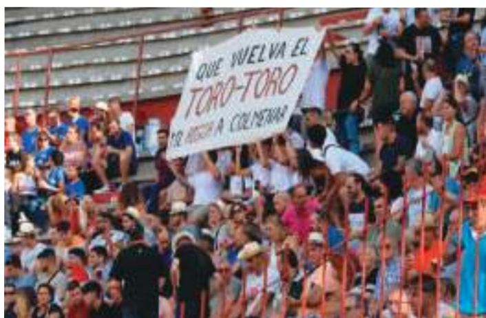
Pancarta reivindicativa en el tendido 5