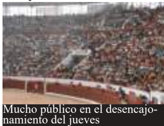
Mucho público en el desencajonamiento del jueves

“Que vuelva el toro-toro y el rigor a Colmenar”, muchos pensamos que no estarían mal las dos cosas. En primer lugar saltaron los novillos de la ganadería de Castillejo de Huebra, que se habrían de lidiar el sábado, lástima lo mal que se percibe el sonido en esta plaza, pues no