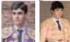
de Manuel Sánchez