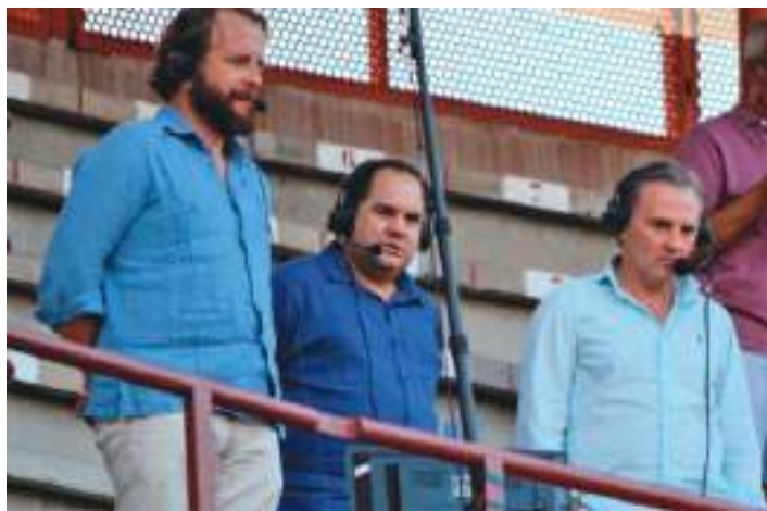
Los de Telemadrid en La Corredera