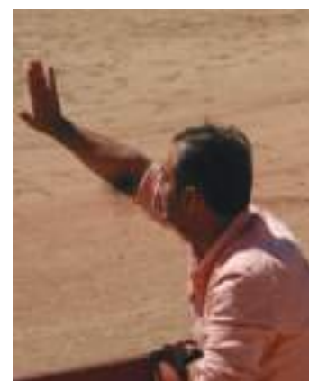
El empresario dando instrucciones en el descajonamiento del domingo