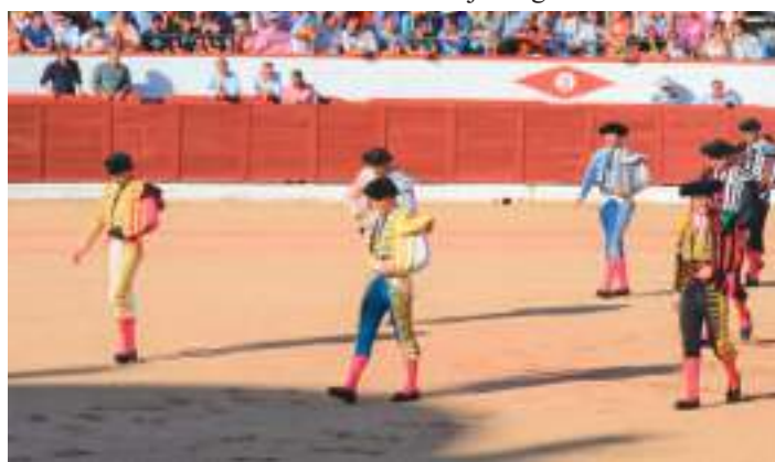
Paseillo del Lunes de Remedios.