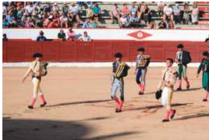
Paseillo de la corrida del Domingo de Remedios