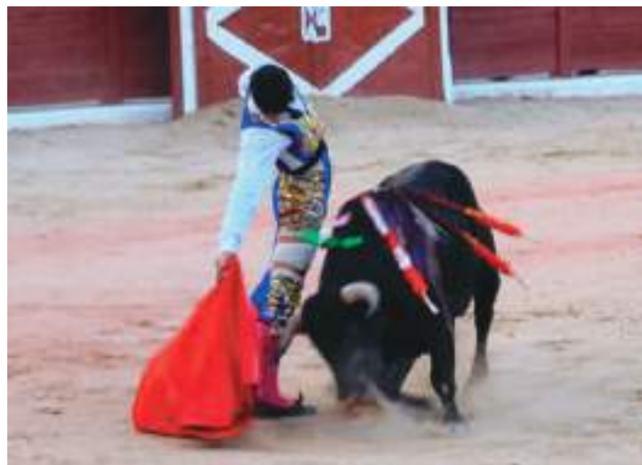
Derechazo de Chicharro con el traje recompuesto