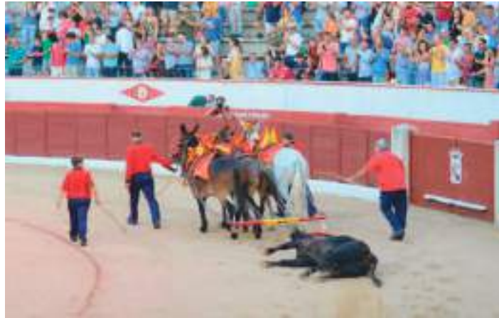
Al toro "Mocito" de la ganadería de Zacarias Moreno se le premió con la vuelta al ruedo.

venta de entradas, tanto en los días dedicados a la venta de abonos como en la de entradas sueltas. Movido más por mis ganas de que Colmenar vuelva a ser una referencia en lo taurino, le dije que seguro que habría buena afluencia de público, ya que los carteles eran de una plaza de primera. Lamenté constatar que mi amigo llevaba razón. No me consuela, como me comentó posteriormente otro amigo, que con carteles similares en Bilbao hubo una cantidad parecida de público.