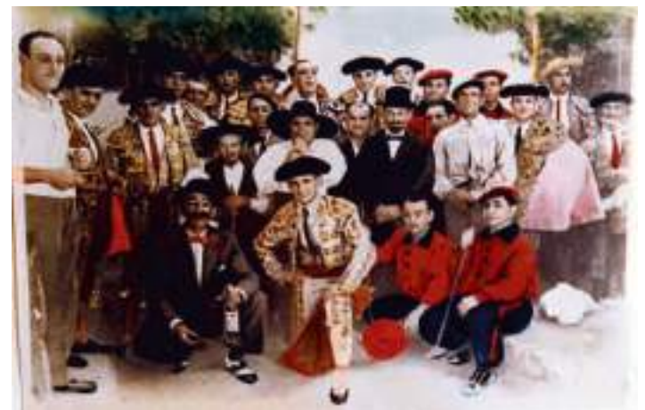
Aficionados año 1946